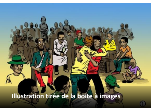
Illustration tirée de la boîte à images

La littérature sur la consolidation de la paix et la justice transitionnelle met en évidence comment la paix et la justice sont souvent difficile à atteindre en même temps. La réconciliation et l'amnistie pour les actes de violence commis peut aider à mettre rapidement fin à la violence et d'apporter la stabilité, mais elles peuvent alimenter un sentiment d'impunité et compromettre le respect des droits de l'homme, la responsabilité et la légitimité des pouvoirs publics à long terme. La poursuite des auteurs pourrait promouvoir un sens de la justice, mais pourrait compromettre la stabilité et la volonté des antagonistes de se joindre au processus de paix.