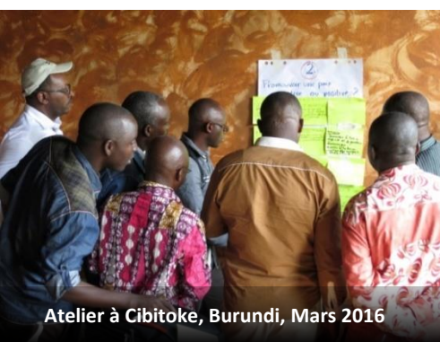
Atelier à Cibitoke, Burundi, Mars 2016

La popularité des CPLs peut être comprise comme une partie d'un 'tour local' dans la consolidation de la paix au cours des deux dernières décennies. Les praticiens du développement sont devenus de plus en plus conscients que, pour être efficaces, les accords de paix au niveau national nécessitent le développement de l'appui au niveau local. De plus, en tenant compte du caractère localisé et civil de nombreux conflits contemporains, les processus de paix au niveau local se sont avérés nécessaires, parallèlement aux initiatives nationales. De même, les résultats décevants sur les programmes de consolidation de la paix et de renforcement de l'Etat impulsés par les bailleurs ont convaincu beaucoup de donateurs de la nécessité de faire participer activement les communautés locales dans la consolidation de la paix, et se baser sur la compréhension contextuelle, et les ressources locales.