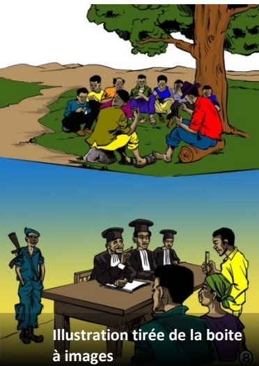
Illustration tirée de la boîte à images

Les institutions coutumières et leurs dirigeants pourraient avoir perdu l'autorité et la légitimité, en ayant été la cible de violences ou d'avoir été complices de la violence eux-mêmes. De plus, la préférence des communautés autochtones sur les pratiques coutumières peuvent plutôt être le résultat d'un mauvais accès au fonctionnement de la justice formelle, plutôt que des préférences sur les normes coutumières et les valeurs. Ces débats ont donné lieu aux débats académiques sur la mesure dans laquelle 'l'Etat' et 'la coutume' pourrait coexister, ou si les institutions coutumières ont besoin éventuellement d'être adaptées ou d'être intégrées dans l'Etat. Pour les comités de paix locaux, une question importante est donc de savoir dans quelle mesure se baser sur les structures et les normes coutumières.