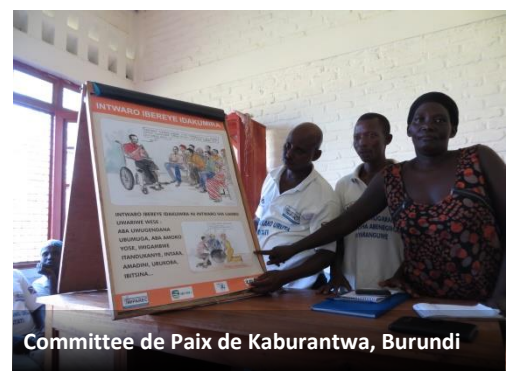
Committee de Paix de Kaburantwa, Burundi

L'établissement ou l'appui des soi-disant Comités de Paix Locaux (CPLs) ou de structures similaires est devenu une stratégie importante dans la trousse à outils des organisations de développement locales et internationales qui visent à améliorer la justice locale et la paix après les conflits violents prolongés. Ces comités au niveau du village, de la ville ou de la région sont souvent considérés comme des mécanismes de transition, en substituant ou en occupant la place des institutions gouvernementales locales, pour arriver à des solutions locales aux problèmes locaux de manière participative. Ils peuvent jouer un rôle dans l'alerte précoce et l'action préventive locale, en facilitant le dialogue local et l'amélioration des relations communautaires, ainsi que dans la réconciliation au niveau local et la recherche de la vérité. Même si dans plusieurs milieux ils découlent de mandats nationaux, dans de nombreux cas, ils sont le résultat d'initiatives locales, ou des interventions des organisations de la société civile locale ou internationale. Souvent, ils se fondent sur des institutions locales existantes, telles que les autorités coutumières, organisations religieuses, ou des associations locales (des femmes) et ils peuvent utiliser les moyens traditionnels, non judiciaires de la résolution des conflits et de la justice.